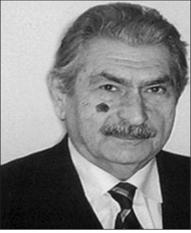
Xalq şairi Söhrab Tahir