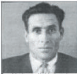
Nubarəli Nobarı, Sosialist Əməyi Qəhrəmanı

Şamaxıda əməkde, təhsildə, idmanda parlaq uğurları ilə seçilən bir qəsəbə