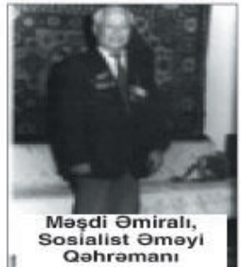
Məşdi Əmiralı, Sosialist Əməyi Qəhrəmanı