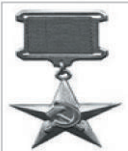
Hüseyin Həsənpur, Sosialist Əməyi Qəhrəmanı