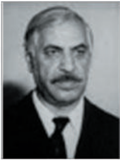
Balas Azeroğlu xalq şairi