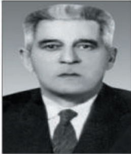
Əhməd bəy Şeybani

12 şəhriyər (3 sentyabr 1945-ci il) elmiyəsini İran da-xilində yayılan gündən azər-baycanlı vətənpərvərlərin sə-nədi necə hərəratlə və se-vinclə qarşıladığı göz-üzü-müzün qabağında.