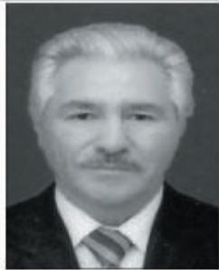
Tariyel Ümid İrənlı Mühacirlər Cəmiyyəti ədəbi birliyin sədri

Bizdən uzaq ulduzların Təbəssümü deyim ona; Bu həyatı dərk etmədən Yaşamağın nə mənası... Ana-ana! Sənin haqqın azadlığın Ümid olub, Baxışların Ümid yolu, Övladların igid olub, Övladına döşlərindən Süd vermisen. Gözlerindən, od vermisen. Vətənə də ana deyib, Bir müqəddəs ad vermisen. Sən anasan, Sən vətənsən. Qoy mən deyim vətən-ana! İndi sənin, övladların Məşəl kimi yana-yana, Əsarətə fəlakətə, Qılınc çəkir. Azadlığın sənə üstə Qucaq-qucaq Ulduz tökür. Vətən daha nə inlə sen, Nə tapdalan! Sən ki, odlar diyarsan, Qoy alovla dönsün balan!